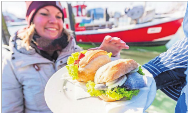
Zugreifen und Küstenkulinarik vom Feinsten genießen.