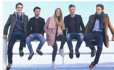
Days of Northern Light: Die junge Band aus Oldenburg begeistert ihr Publikum

Am Ostersonntag startet die Ostereiersuche am Strand von Haffkrug bereits um 11 Uhr am Strand neben der Seebrücke. Noch früher ist der Osterhase nur noch in Sierksdorf unterwegs, denn hier versteckt er seine Ostereier bereits am Ostersonnabend rund um das Feuerwehrgerätehaus. Für jedes gefundene Osterei gibt es eine kleine Überraschung. An