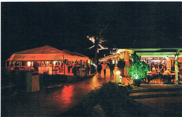
Zauberhaft illuminiert lädt die Scharbeutzer Dünenmeile am Sonnabend, den 27. und Sonntag, den 28. Oktober zum „feurigen“ Programm ein

Ein Wochenende lang wird die Lübecker Bucht in ganz besonderes Licht getaucht. Die Lichterliebe lässt Scharbeutz und Timmendorfer Strand drei Tage lang erstrahlen. Unzählige Lichter und Illuminationen tauchen den Ortskern am Freitag, den 26., Sonnabend, 27. und Sonntag, 28. Oktober in ein romantisches Licht. Und dazu gibt es ein buntes Programm.