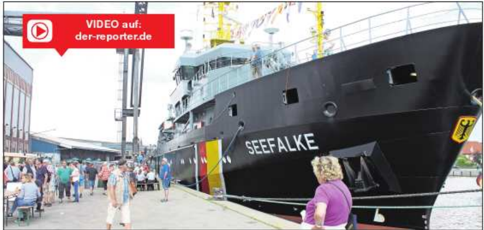
Auch die „Seefalke“ aus Cuxhaven lud zum „Open Ship“ und bot eine fantastische Aussicht über den Hafen.

Höhepunkt war auch in diesem Jahr wieder eine Autogrammstunde von „ZDF-Küstenwache“-Star Elmar Gehlen. An beiden Tagen war das Fanclub-Zelt von treuen Fans um-