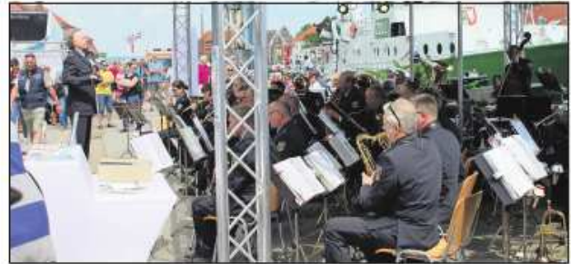
Das Bundespolizei-Orchester trug zur maritimen Stimmung bei.