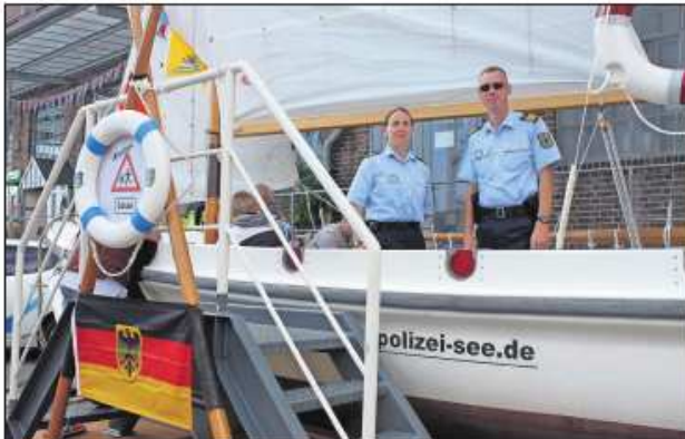
Bei der Knotenschule der Bundespolizei See konnten auch alte Seebären noch etwas lernen.