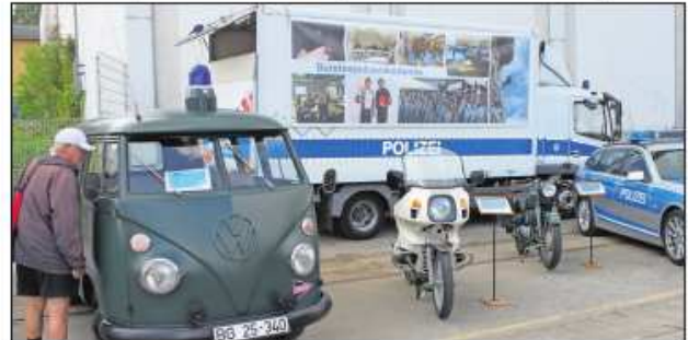
Alte BGS-Fahrzeuge für Oldtimer-Liebhaber.

Jede Menge musikalische Unterhaltung sorgte für eine perfekte maritime Stimmung, dazu gehörte das Bundespolizei-Orchester, der Shanty-Chor „Eutiner Wind“ und „Combo Zolla“, die Big Band des Zolls. Beim Auslaufen und der Abschlussfahrt des Küstenwachekonvois (das Video dazu finden Sie auf www.der-reporter.de ) konnte man den Schiffen noch lan-