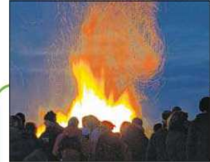
Osterfeuer: Auf der Rennkoppel in Bad Segeberg wird am Sonnabend traditionell ein großes Osterfeuer entzündet. Dazu gibt es für die Gäste Leckeres vom Grill sowie warme und kalte Getränke. Los geht es ab 18 Uhr. Aber nicht nur in Bad Segeberg, überall im Norden steigen Flammen auf. Am Süstrand von Burgtie auf der Insel Fehmarn brennt das Feuer allerdings erst am Ostersonntag. Start ist ab 20 Uhr.