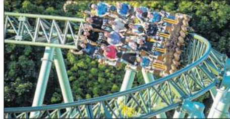
Action für die ganze Familie: Ab heute ist der Hansa-Park in Sierksdorf wieder geöffnet. Highlight ist die Achterbahn „Der Schwur des Käran“. Auch die kleinsten Gäste dürfen sich bald auf ihre erste Achterbahn „Der kleine Zar“ freuen. Am Sonnabend und Sonntag können alle Kinder bis 14 Jahre am Ostereier-Wettbewerb teilnehmen. Jedes Kind, das bis 12 Uhr sein selbstbemaltes Ei abgibt, erhält eine Überraschung.