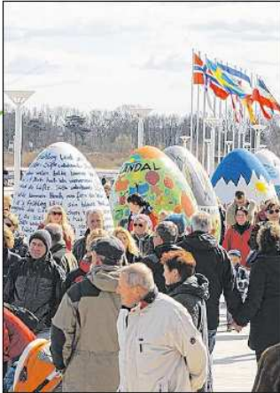
Alles rund ums Ei: Im Brügmanngarten in Travemünde ist das ganze Wochenende Programm – insbesondere für Familien mit Kindern. Vor allem die Kleinsten dürfen sich auf Ostersonntag freuen: Um 13 Uhr beginnt die Ostereiparade mit der Band „Get Happy Brass Band“. Start ist am Ostpreußenkai. Danach ab 15 Uhr werden im Brügmanngarten fleißig Ostereier gesucht. Am Ostermontag ab 11 Uhr geht das Familienfest weiter.

Ob Eiersuchen mit der Familie oder einfach raus in die Natur: Die LN geben Ausflugs-Tipps