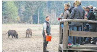
Ab in die Natur: Auf einem Spaziergang durch den Erlebniswald Trappenkamp gibt es viel zu entdecken. Im Wildschweinwald wuseln jetzt im Frühjahr die Frischlinge herum. Täglich um 14 Uhr ist Fütterungszeit. Im Waldhaus können an diesem Wochenende von 12 bis 17 Uhr die Kinder unter Anleitung einen Osterhasen aus Holz, Zweigen und Moos basteln.