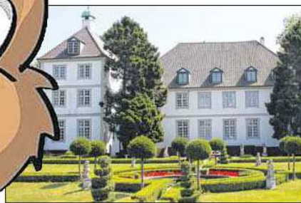
Kunst und Kultur auf dem Gut: Das Ausflugsziel – zum Beispiel einer schönen Fahrradtour – könnte am Oster-Wochenende das Gut Panker bei Lütjenburg sein. Mitten in der Holsteinischen Schweiz liegt das schicke Anwesen mit kleinen Geschäften, Restaurants, Cafés und Galerien.

Live-Musik am Strand: Unter dem Motto „Ostern Unplugged“ treten im Küstenort Scharbeutz von heute bis zum Ostersonntag verschiedene Bands auf. Außerdem ist ein Ostermarkt mit zahlreichen Ständen aufgebaut. Heute ab 16 Uhr spielt die Gruppe „Mimi Crie“, am Sonnabend ab 18 Uhr sorgt die Band „Roarings 40's“ während des Osterfeuers am Strand für eine gemütliche Atmosphäre.