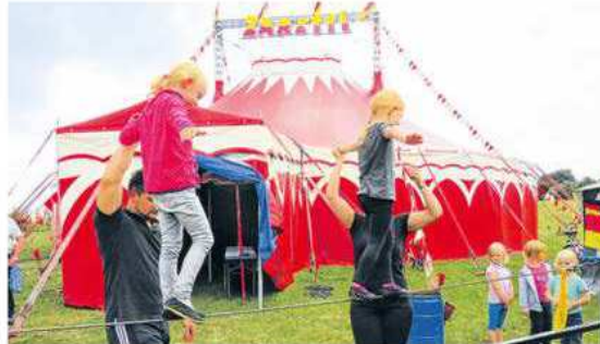
Im Herbst ist ein großes Zirkusprojekt mit Hunderten Kindern geplant. Die TALB will damit Familien in die Region locken.