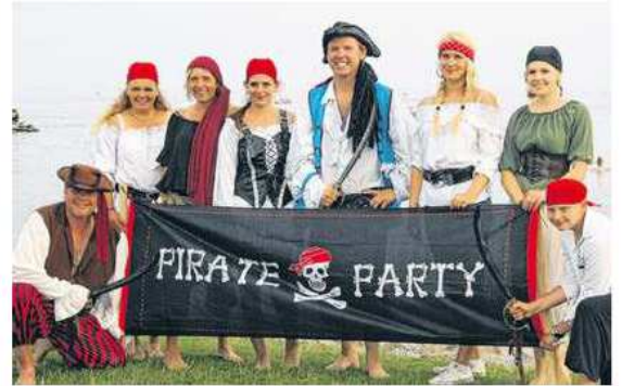
Viele Kinder stehen auf Piraten. Deshalb gibt es im Juli und August die „Piratenwochen“ in Neustadt, Pelzerhaken und Rettin.