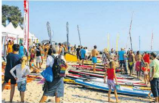
SUP liegt nach wie vor im Trend. Ende Juni macht der World Cup in Scharbeutz Station. Im August steigt in Pelzerhaken das SUP-Festival (Foto).

Ebenfalls neu ist das „Baltic Film Art Festival“. Rosinski kündigt Kurzfilme, ein cineastisches Rahmenprogramm und einen großen Premierenabend an. Stattfinden soll die Veranstaltung vom 29. September bis 1. Oktober im Glückscfé im Neustädter Haus der Manufakturen. Zusätzliche Details, darunter die Namen einer prominent besetzten Jury, sollen noch bekannt gegeben werden.