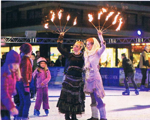
„Ice, Ice, Baby!“ - Auf der Scharbeutzer Dünenmeile können Sie jetzt Schlittschuh laufen oder Eisstock schießen - bis zum 14. Februar

Winterschlaf? Aber nicht in den Ostseebädern der Lübecker Bucht! Hier wird es gemütlich, romantisch, abenteuerlich. Neben den regelmäßig stattfindenden Fackelwanderungen am Winterstrand locken etliche Highlights winterfeste Besucher nach Scharbeutz, Haffkrug und Neustadt. Hier bietet man Einheimischen und Gästen ein reizvolles Programm.