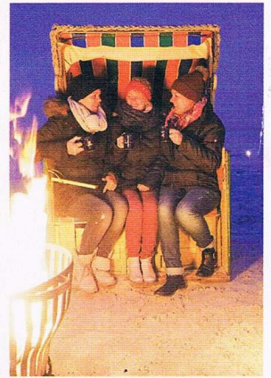
„Gestrandet“ bei Glühwein in romantischem Ambiente

gramm sorgt für angenehme Unterhaltung, unter anderem mit Lesungen und Gitarrenmusik. In Pelzerhaken (bei Neustadt) entsteht in diesem Jahr ein Winterstranddorf, das für jeden etwas zu bieten hat. Hier können Sie freitags ab 16.00 Uhr, samstags und sonntags ab 12.00 Uhr direkt auf der Terrasse der „Villa Meeresrau-